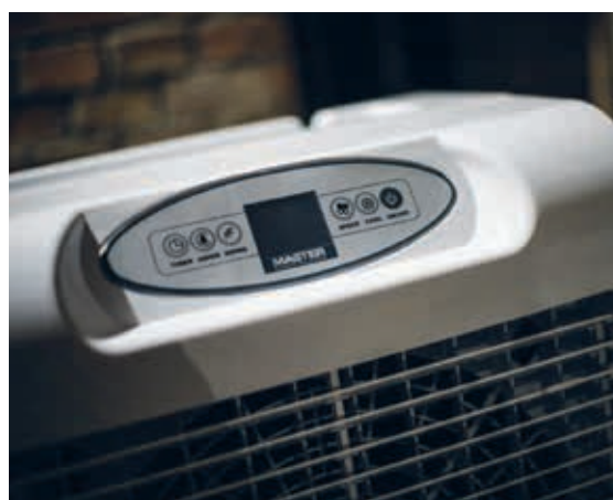
CCX 4.0 Panel de control